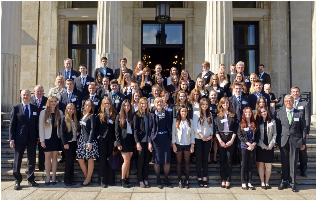
Empfang der Stipendiaten, die am vierwöchigen Betriebspraktikum im Ausland teilgenommen haben, auf Villa Hügel

Die Stipendiaten sollen durch dieses vierwöchige Betriebspraktikum die Möglichkeit erhalten, erste Einblicke in das Berufsleben zu gewinnen, Fremdsprachenkenntnisse zu verbessern und eine ihnen bisher fremde Kultur kennen zu lernen. Die Schüler sollen zudem mit künftigen beruflichen Anforderungen konfrontiert und auf das Berufsleben gezielter vorbereitet werden.